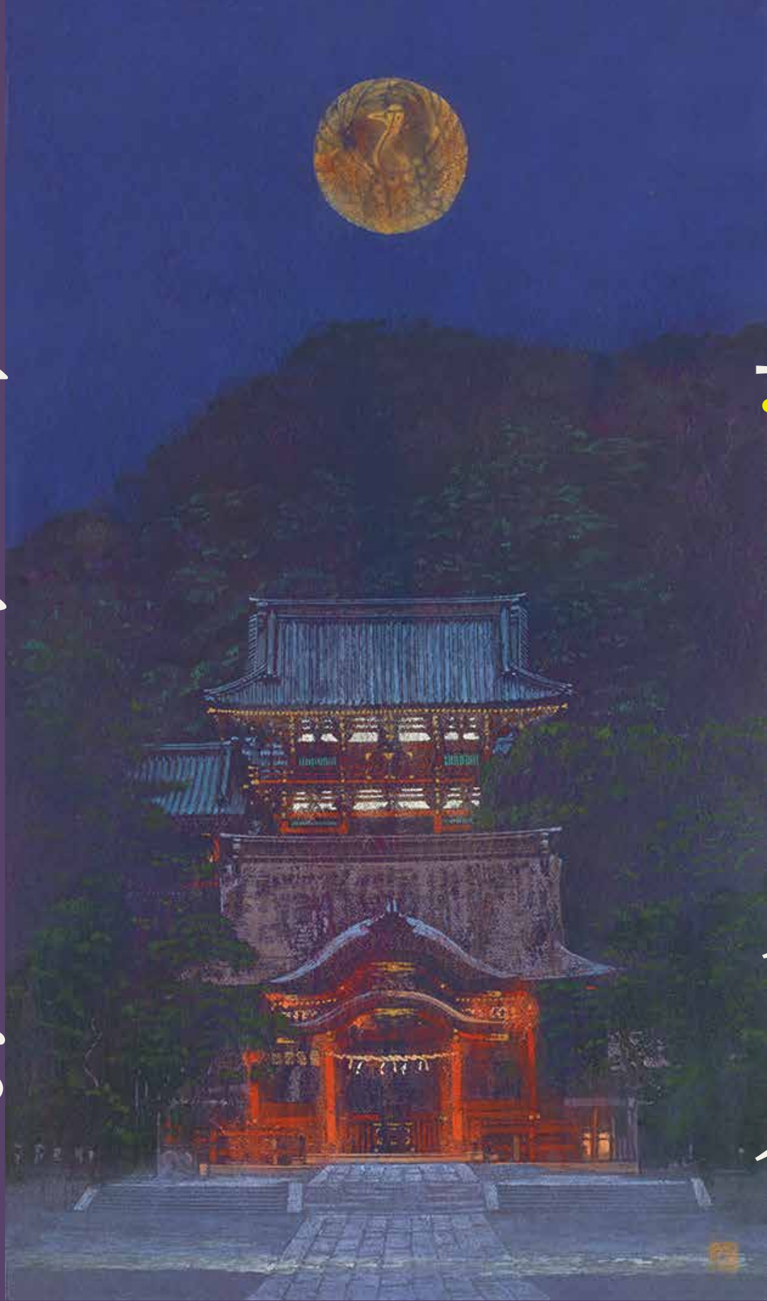
「夜鶴」2017年 敬愛まちづくり財団蔵