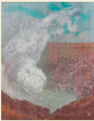
「あそのみ池」阿蘇神社 2012年