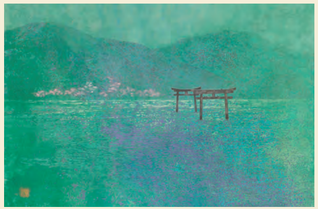
「和多都美」海神社 2018年