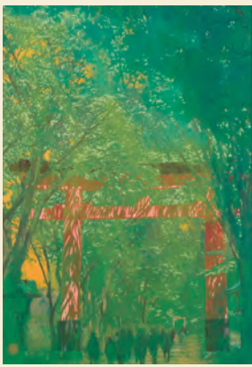
「氷川参道」氷川神社 2018年